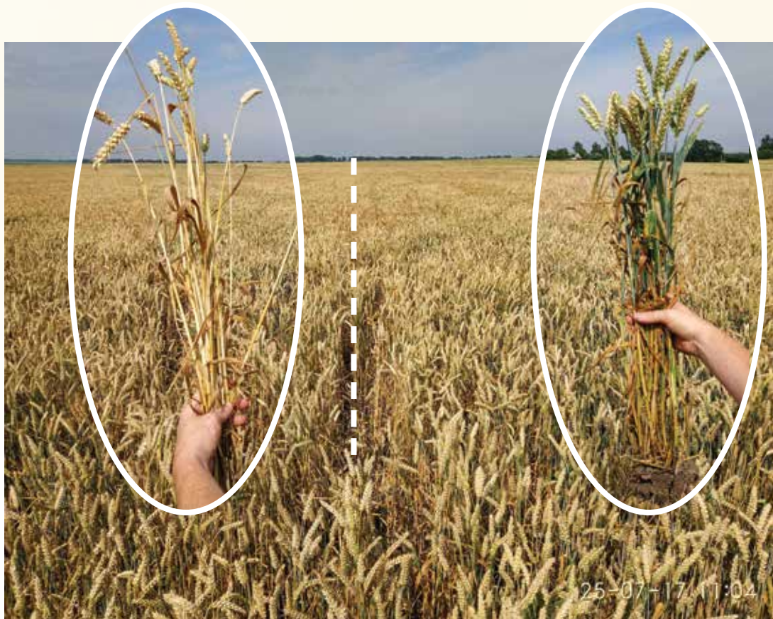
Стандарт, 2 л/га